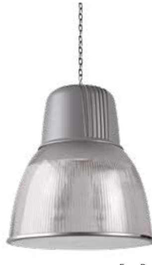
Easy Deco IP40