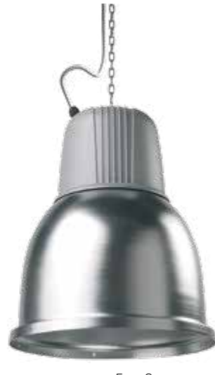
Easy S IP23 (senza vetro/with glass)