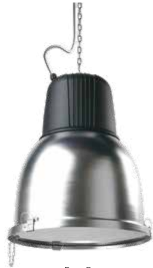
Easy C IP65 (con vetro/with glass)